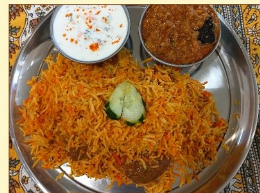
ビリヤニセット Biryani Set ¥1,450~ 大盛り + ¥200 (Large size + ¥200)

*バターチキンカレー Butter Chicken Curry *サラダ *ナン Salad Naan *ドリンク Soft Drink