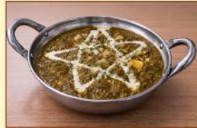
サグチキンカレー Sag Chicken ¥1,200