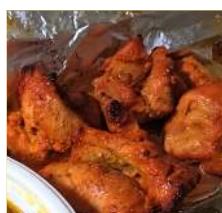
チキンティッカ4P Chicken Tikka4pcs