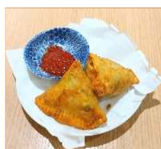
サモサ 2 P Samosa2pcs