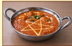
バターチキンカレー Butter Chicken ¥1,200