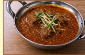
日替わりカレー Daily Special ¥1,100

*カレー1種類 Choose 1 Curry *ナン or サフランライス Naan or Saffron Rice *サラダ Salad *ドリンク Soft Drink