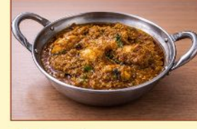
チキンカレー Chicken ¥1,100