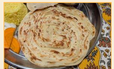
ラチャパラタ Laccha Paratha