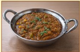
野菜カレー Vegetable ¥1,100