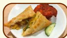
Samosa & Chicken