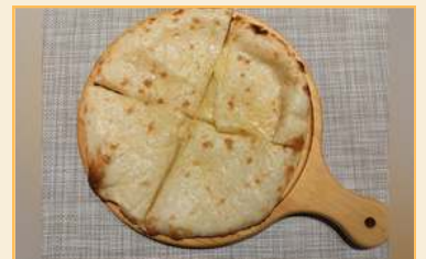
チーズナン Cheese Naan