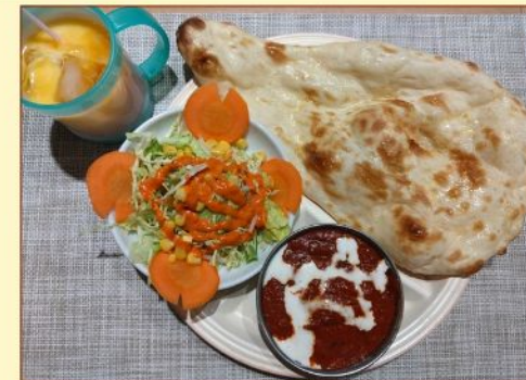
お子様セット Kids Set ¥680

バターチキン・マトン + ¥50 Butter Chicken · Mutton