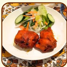
Chicken Tikka 2P