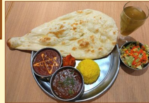
炭火焼チキン&2種カレーセット Chicken Tikka & 2 Curry Set ¥1,400~

ナンBIGサイズ or サフランライス大盛り無料! (BIGサイズ・ライス大盛りはお持ち帰りできません) Large size naan or Saffron rice large free! (Large sizes cannot be taken home.)