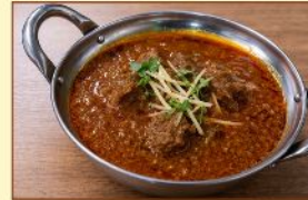
マトンカレー Mutton ¥1,200