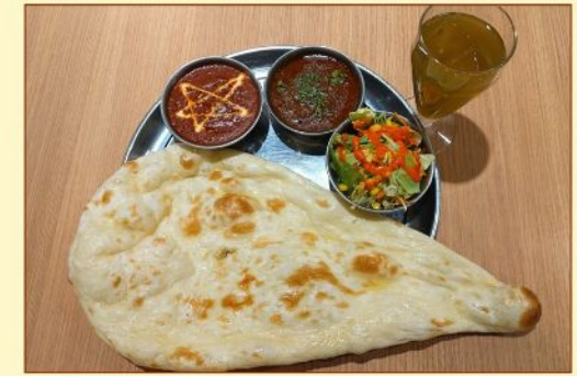
2種カレーセット 2 Curry Set ¥1,250~

バターチキン・マトン + ¥50 Butter Chicken · Mutton