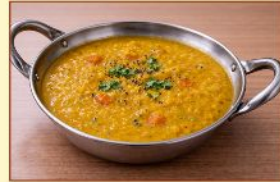
ダルカレー Dal ¥1,100