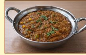
キーマカレー Keema ¥1,100

ナンBIGサイズ or サフランライス大盛り無料! (BIGサイズ・ライス大盛りはお持ち帰りできません) Large size naan or Saffron rice large free! (Large sizes cannot be taken home.)