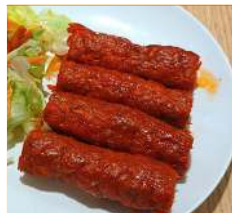
シークカバブ4P Seekh Kebab4pcs